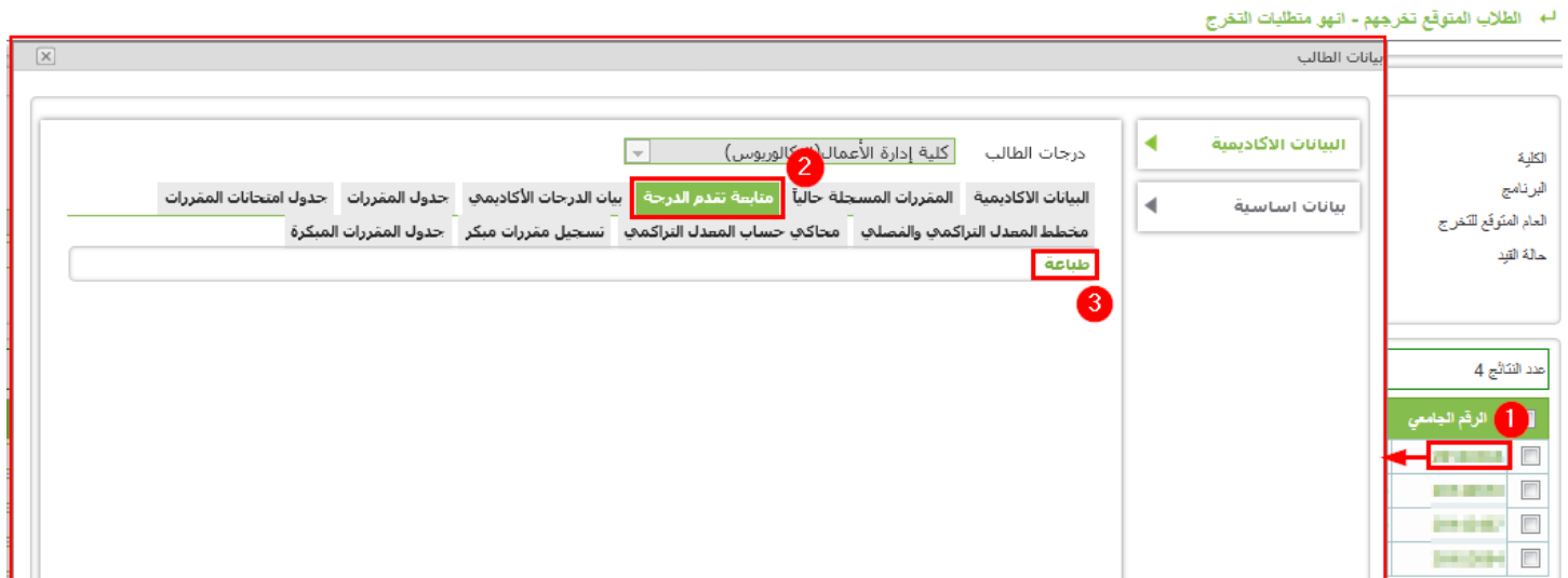
Figure 4 - بيانات الطالب