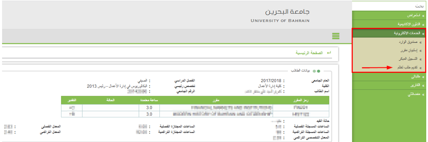
Figure 1 – الصفحة الرئيسية

يمنح النظام الصلاحية للطالب للتقدم بطلب التظلم من نتيجة مقرر واحد أو عدد من المقررات ، وتوضح الصورة أدناه هذه الخاصية: