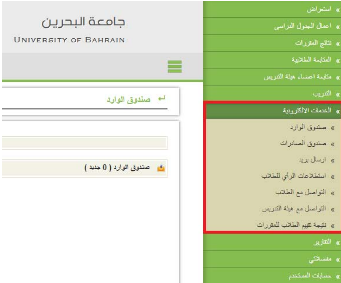
Figure 1 - شاشة الخدمات الإلكترونية

تتيح هذه الخاصية للمستخدم الدخول لصندوق الوارد والصادر، وكذلك إرسال بريد إلكتروني والاطلاع على استطلاعات الرأي للطلاب ونتيجة تقييم المقررات، بالإضافة للتواصل مع الطلاب وأعضاء هيئة التدريس، وتوضح الصورة أدناه هذه الخاصية: