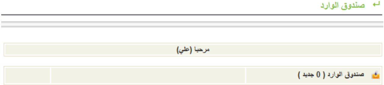
Figure 2 - صندوق الوارد

تتيح هذه الخاصية للمستخدم الدخول لصندوق الوارد وذلك للاطلاع على الرسائل المرسلة له، وتوضح الصورة أدناه هذه الخاصية: