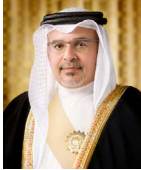
حضرة صاحب السمو الملكي الأمير سلمان بن حمد آل خليفة ولي العهد رئيس مجلس الوزراء الموقر