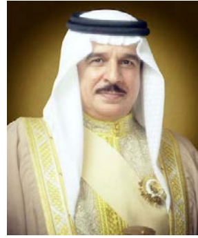
حضرة صاحب الجلالة الملك حمد بن عيسى آل خليفة ملك مملكة البحرين المعظم