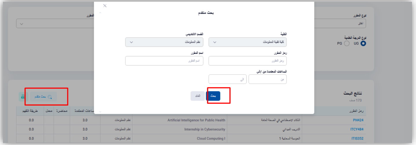
شكل ٥ : بحث متقدم عن المقررات